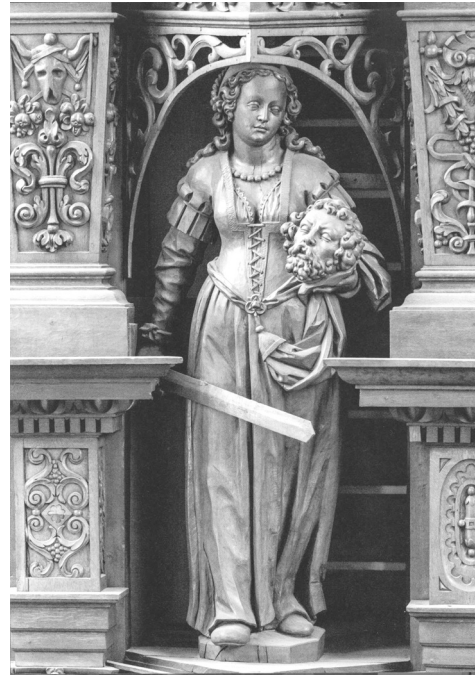
Judith (op de linker toren naast het hoofdfront)