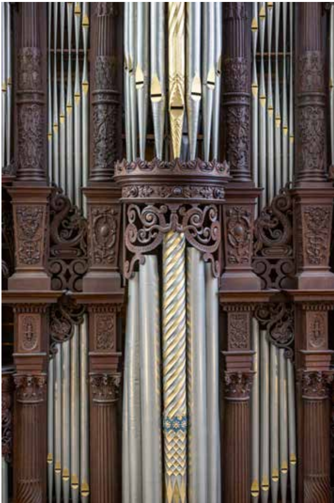
Centrale toren met geciseleerde pijpen.